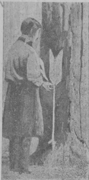
2 еер. Вздымщік вундө усјас һемецкөј подсочка способөн ужаліг.

Код способыс - нө тајө урчитөм способјасыс буржык, кодногөн ужавны буржык велөдчыны? Медбур способөн лыддыссө һемецкөј.