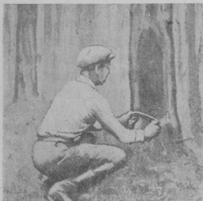
5 сер. Пу банјөдөм.

мастер щоктөм серті. Банјодан иныс кырссө бостоны рөвнөј слөјөн сізі, мед колас кырсыс, гөрднөсө-корішнөвөј слөјыс, колө унавылө саңтиметржын кызта, мед сені некущөм потас ез вөв. Сөмын медулысас, кытчө көсјөны көзырок тувјавны, кырссө кызжыка колөны. Банјөдөм инын мед некущөм жежыд ін (пу) оз ло. Жежыд иныс овлө, кор кырс бостысјасыс лока ужалөны, лшнөј кыза кырссө нещыштөны.