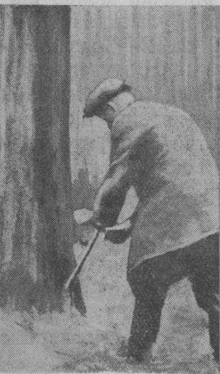
7-сер. Буровј прїјлмнїк пуө вөчө.

Жөлөбсө піскөдігөн-жө вундөны вылысладор жөлөб помсаңыс өтарө-мөдарө первојја гоз усјассө. Усјас жұждаыс 1 см, куғтасө поғө вөчны разнөја торја участокјасын. Өғи участок вылын став усыс мед өт-