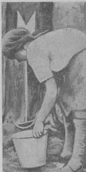
9 сер. Жівіца чукөртыс-кістө көзырокыс жівіцасө.

Жівіца-кө чукөртөны зер бөрын да пріјомныкас-кө зер ваыс вескалөма, воронкаыс сіјөс кістөны жівіцасө