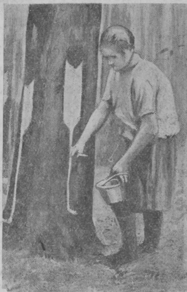
11 сер. Жівіца чукөртыс жөлөб весалө.

Проммастер пасјө, кущөм участок вылыс (кущөм вздымщїкыс) унаө жівіца лунтырөн чукөрмөма, кущөм сорт жівіца, да сетө сыјылыс жівіца чукөртысгыс квітанцїја.