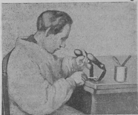
3 сеп. Кышжынја гогїн пујас гогнавны (банјөдны) да сіјөс төчїтөм.

Тажө став урчїтөм инструментјасыс колөны лөсөдчан ужјас вөчны,