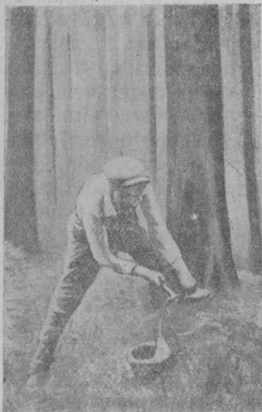
6 сер. Рабочöј тувјалö кöзырка пу банјöдöм бöрын.

Кöзыроқыс-кö пу бердас оз стöча ласкыс, колö сіјöс, пу сертыс; лібö вескöдны, лібö кусытны, лöсöдны шук сіі, мед кöзырока пуа костын некущöм щель оз ло. Кöзырок тувјалан местаын кырғас ем-кö щель, кöзыроксö тувјавтöç колö гогинөн сеті