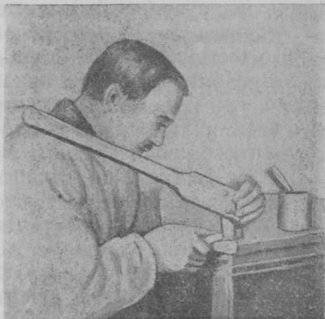
4 сèр. Рабочòј інструмент тóчитò, хаксò правільножа пуктòма.

Тóчитòм хак да стамеска мед брїтвакофòс вòліны. Сòмын сещòм інструментжасөн кокҥы усјас вундавны пу вылын да пуыс уна жївїца сетас.