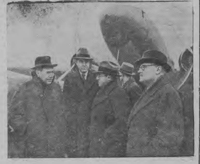
СССР-лэн, США-лэн но Великобританилэн представительёсылэн Совещаниязы английской но американской делегациослэн Москвае вузмы. СУРЕД ВЬЛЫН: Москваын пумитан. Паллянысен буре: лорд Бивербрук, г. Гарриман, СССР-лэн США-ысь Чрезвычайной но Полномочной Пссолз К. А. Уманский эш но СССР-лэн Народной Комиссар'ёсызлэн Советсылэн Председателезлэн Заместителез, Инстранный Уж'ёсыя Народной Комиссарлэн Заместителез А. Я. Вышинский эш.