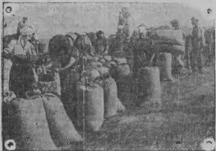
Калыклэсь вань кужымзэ—тушмонзэс быдтонне. „Горная поляна“ сталинградской пригородной совхозын фронтэ кошкэм писсты воштыса ю-нчнь октон-калтон ужын ужало трос пöрась кышноос. Совхозлэн шиньыр вылаз пöрась кышноос окто-калто кутсам йыдыз.