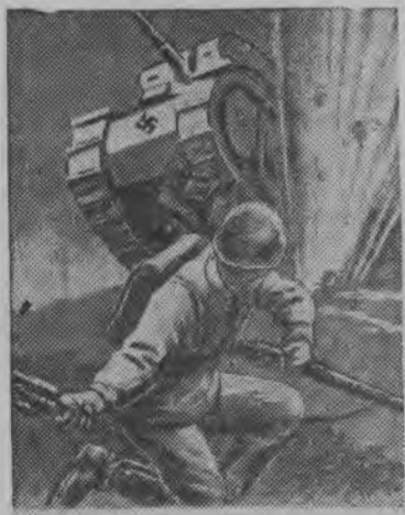
СМЕЛОМУ И УМЕЛОМУ ТАНК НЕ СТРАШЕН.