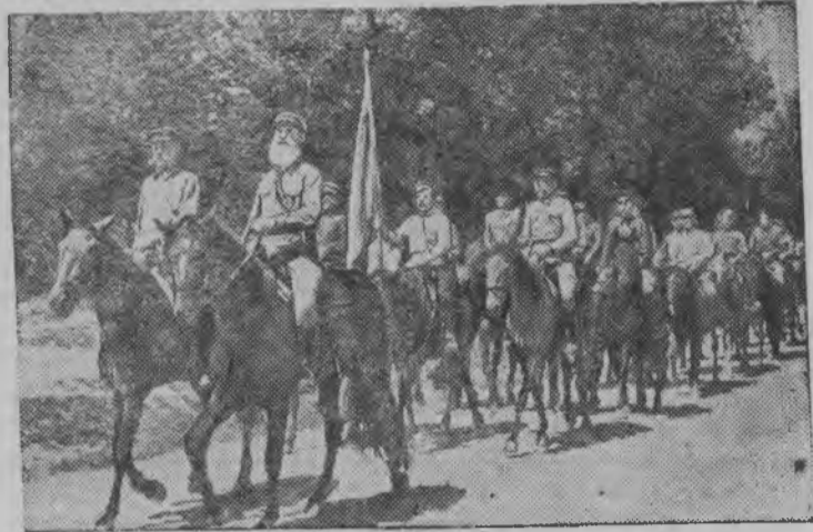
Калык'ёсты военной ужлы дышетон. (Казакской СССР) „Луч Востока“ колхозын трос Семиреченской казак'ес уло. Со нунал'ёсы, куке вань советской калык жутскиз советской родиназэ фашистской бандит'ёслэсь защищать каронэ, татын казак'ёслэн сотнязы кылдыз.

Вылы верамез лыдэ бастыса, Советской правительстволэ кулээн лыд'я болгарской правительстволы та представлениез лэстыны но солэсь вниманизэ обратить карыны со вылэ, что болгарской правительстволэн Советской Союзлы отношениез позицияз но действостыз лойяльной уг луо но соответствовать уг каро СССР-ен кустын нормальной отношением улэсь государстволэн позициялы но действостызылы. Советской правительстволэн мур оскемез'я, со но кызы соотвествовать уг кары аслаз Болгарилэн но болгарской калыклэн интерес'ёсылы“.