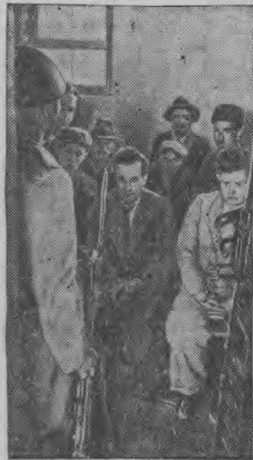
СУРЕД ВЪЛЫН: Немецкой фашист'ёсын кутэм сербской партизан'ёс, расправаез витэн азын.