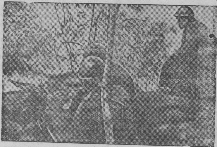
Греко-албанской фронтын итальянской огневой пулеметной позиция.