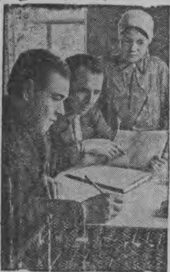
Чишминской районьсь, Башкирской АССР-ысь Буденныйлэн нимыныз нимам колхоз умой укамез понна Республикалэн почётной доскаяз гожтэмын.

Вань дышетйсьёслы сослэн примерзыя ужано.