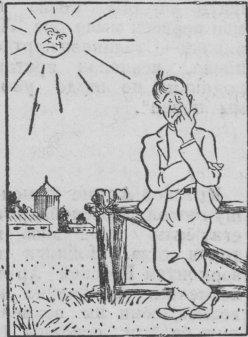
Шунды вань, ужаны мыл уг поты.

Энгельслэн нимыныз нима колхоз - миллионер (Кошкинской район, Куйбышевской область)—ВСХВ-лэн участникез, одигетй степень дипломен наградить каремын.