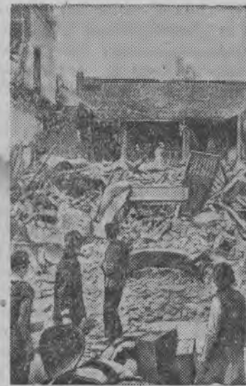
Суред вылын: Японской бомбардировка дыр'я Ченду городын куашкатэм зданиос.

Японской авиация Китайлэн мирной город'ёсыз вылэ ялам варварской налёт'ёс лэсьтылэ. Бомбардировкаос дыр'я мирной калык бырыны шеде но зданиос разрушаться карысько.