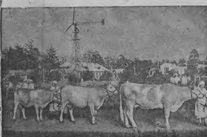
Суред вытын: Скал'ёс прогулкаын, „Животноводство“ павильон дорын.