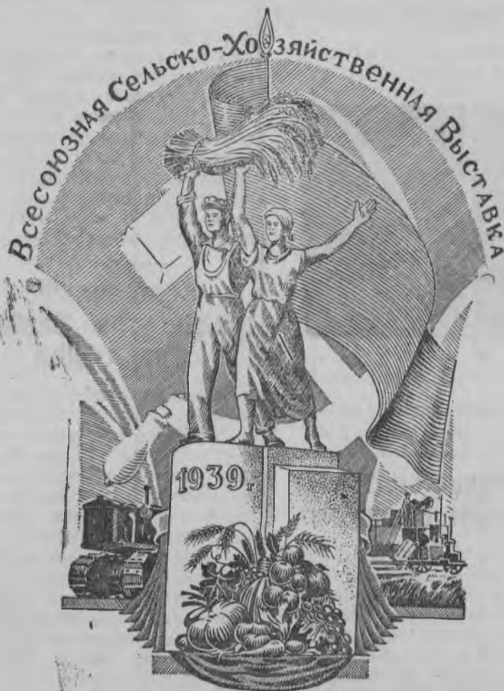
Г. Балашевлэн рисунокез. (Крестьянка журналысь).

Али дыре партийной, советской но земельной организациослэн боевой задачаосы, колхозной гурт'ёсын эшшо но юнгес вёлмытоно социалистической соревнованиез, юрттоно колхозник'ёслы, колхозницаослы но сельской хозяйстволэн специалист'ёсызлы, стахановской радэ султуса 1940 арын заслужить карыны колхозной вормонлэн всенародной смотрелэсь почетной званизэ басьтыны.