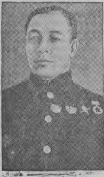
СУРЕД ВЫЛЫН: СССР-лэн Военно-Морской Флотэзлэн Народаой Комиссарез Н. Г. Кузнецов эш.

Овöнь со дыр кыдэкин, ку асьмелэн Военно-Морской Флотмы луоз мырын самой кужмо флотэн.