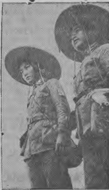
СУРЕД ВЪЛЫН: Китайской выл'ёс—активисткаос.

Китайской вылкышноос Японской захватчик'ёсын нюр'яськыны активной участие принимать каро. Прифронтной гурт'ёсысь калык пёлын соос бадзым агитационной уж нуо, ранить карем боец'ёсын ухаживать каро, военной операциосын участвовать каро.