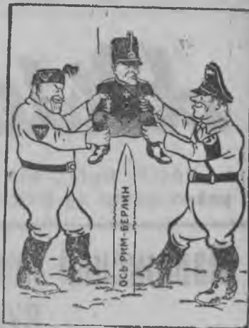
Венгриез Рим—Берлин ось борды присоединить карон.