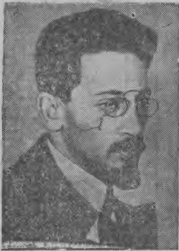
СУРЕД ВЪЛЫН: Яков Михайлович Свердлов.

16-тй мартэ 1939 аре Я. М. Свердловлэн кулэм дырысьныз 20 ар тырмиз. Свердлов Ленинлэн—Сталинлэн партиезлэн верной соратникез, коммунистической партиез но Советской властез организатор'эс но кивалтисьёс пöлысь самой лучшоеныз вал. Со быр'емын вал ВЦИК-е председателе. Я. М. Свердлов кулйз 16-тй мартэ 1919 аре.