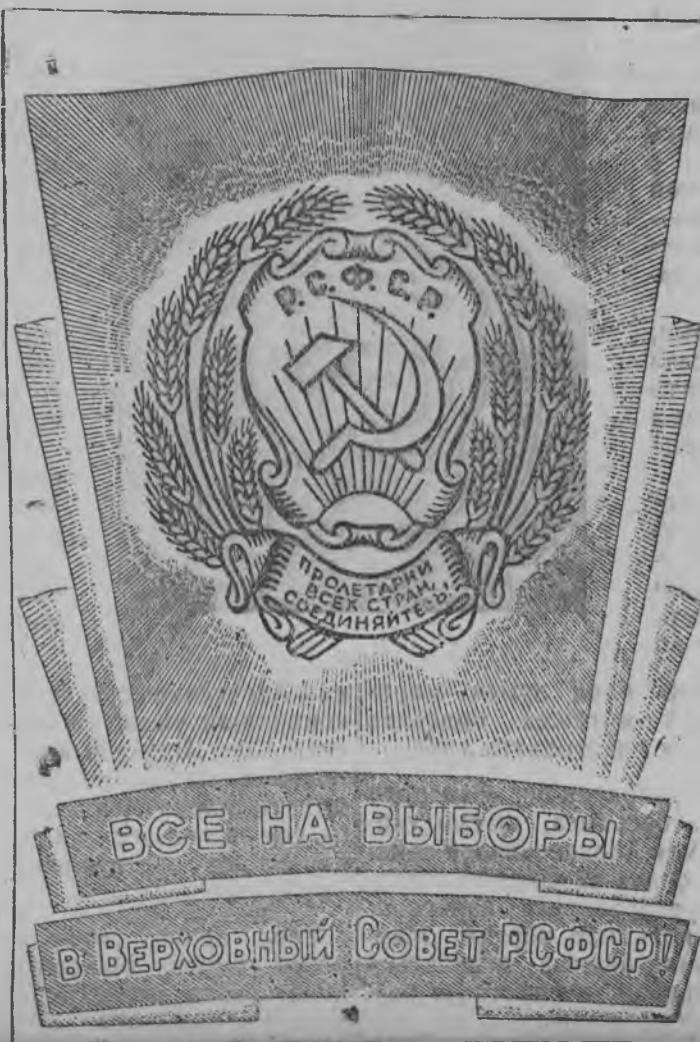
«Ваньды РСФСР-лэн Верховной Советаз бырысьнон!»

Избирательной участок'ёсын коммунист'ёсын но беспартийной патриот'ёсын агитационно-массовой уж'ёс умой нуыса кылем выбор сярысь вуоно РСФСР-лэн но УАССР-лэн Верховной Совет'ёсазы быр'ён ужешо но умойгес, ужешо но организовано ортчытыны быгатомы.