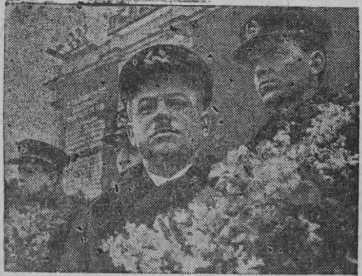
Суред вылын: (Бурьсен паллянэ) Ширшов, Федоров, Папанин но Кренкель эш'ёс. Комсомольской площадиын, митинг дыр'я, трибуна вылын.

17 марта 1938 аре Москвае Северной полюсэз победить нарысьёс вуизы, страналэн отважной героёсыз Папанин, Ширшов, Креннель но Федоров.