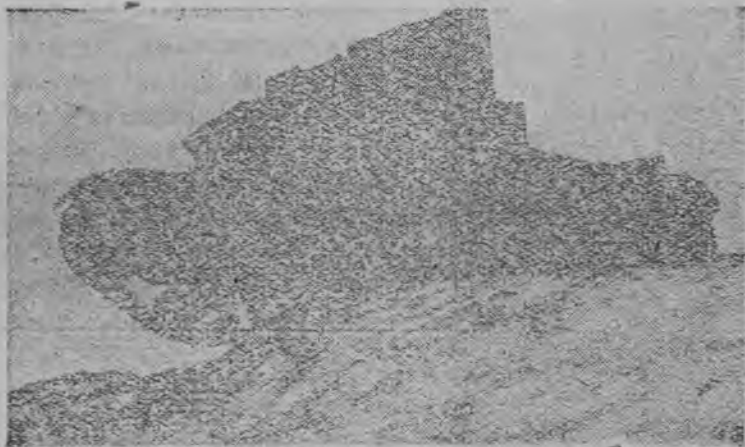
Тани овраге васькон азын.