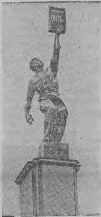
Москваын Всесоюзной сельскохозяйственной Выставкаын.