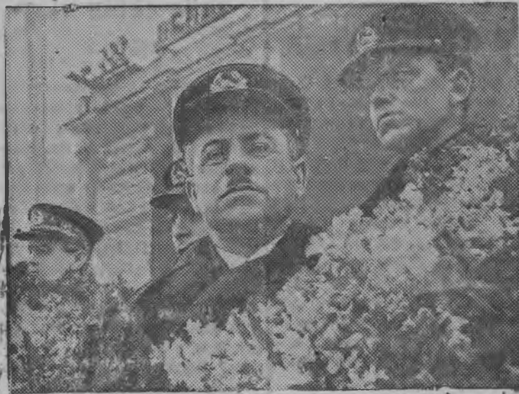
Свред вылын (паллян палысен бур пала) Ширшов, Федоров Папанин, Кренкель Комсомольской площадь вылын митинг ортчытон дыр'я трибуна вылын.