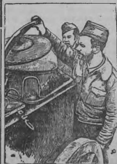
Испанысь республиканской частьёслэн поварзы, республиканской боец'ёслы обед дася.

* * * 14 мартэ уин республиканской авиация Бельчитеын сылысь мятежник'ёсыз озы ик Бельчитеысь Рсайлае мынись 50 грузовик'ёсты бомбардировать кариз. 14 мартэ чукна Альканьиз дорын республиканской истребительёс 30 фашистской „Фиат“ самолёт'ёсын жугиськон нуизы, 6 фашистской самолёт'ёсты уськытэмын. Мукет жугиськонын 3 фашистской „Фиат“ самолёт'ёс уськытэмын на.