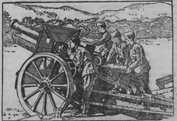
Испаниысь республиканской боец'ёс Итало-германской интервент'ёсын жугиськоннын асьсэ страназэс героически возьмало. Рисунокын: Республиканской армиясь артиллерист'ёс противниклэсь позицияз ыбыло.

Леванта фронтын воздушной бой дыр'я республиканец'ёс интервент'ёслэсь кык мотор'ем бомбардировщик'ёссэс но куинь истребитель'ёссэс куштйзы. Республиканец'ёс кык истребительной самолёт'ёссэс ыштйзы. Летчик'ёсыз парашютэн спасаться карыськызы.