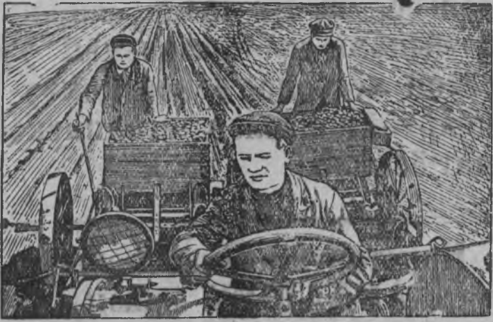
Снимок: С. С. Войнов тракторист „Весна“ колхозы Орловской области колхозник'ёс картошка мерттонын 7 га нуналлы нормая, соос 8—9 га выполнять каро.