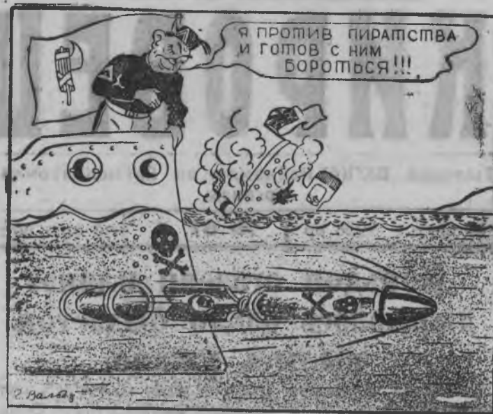
Надводной минаос (ласковоесь) подводной минаос (обыкновенноесь).