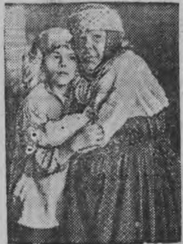
СНИМОКЫН: народной артистка Массалитинова—Горькийлэн бабушкаезлэн роляз но школьник Ларский — Леша Пешковлэн роляз.