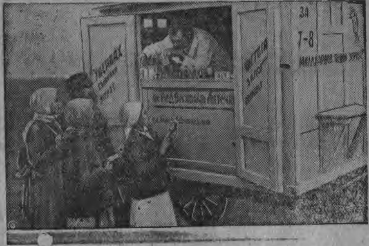
Чебоксарской районнысь Чапаевлэн нимыныз нимам колхозлэн луд вылаз аптекоуправлениялэн фургонэз.

Чувашской аптекоуправления луд вылын ужасьёе куспын культурно-бытовой обслуживание ужзы образцово пунктэмын