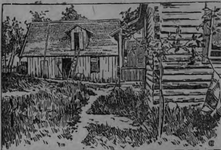
Разливайысь Емельянов эшлэн Сарай дачаез. В. И. Ленин солэн севидлэз ватсаыса улыл'и.