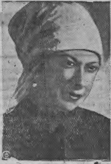
Н. К. Крупская крестьянка лэн дисеныз (1917 арын)

Одиг кунын социализмлэн нормонэзлэн (возможностез) сярись ленинской теориясь исходит карись большевистской стратегия но тактика троцкист'ёсын но правой оппортунист'ёсын штык-