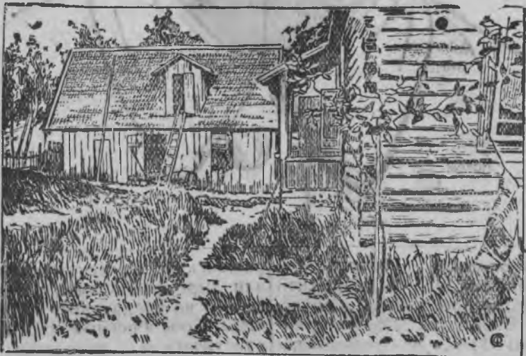
Емельянов эшлэн Разливысь дачаяз сараезлэн сеньиказ В. И. Ленин ватсыса улиз.

УАССР-ысь Совнарком 1937 аре 1 июле пуктэ кинлэне велосипедэз валлы каждоезлы велосипегистрировать кароно. Ровать карон дыр'ятиське, регистраци Райисполкомлэн лаз мынэ. Кин регистрировать мертэк велосипедиз ке, 10 м