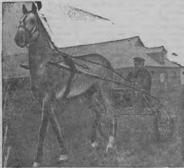
Рысак'ёсыз сюдысь И. М. Мосин „Голубь“ ушпикэз тренировать каре.

Харьковской областысь Гребенковской районьсы „Красная Украина колхоз дас егит будйсь рысак'ёсыз дася.