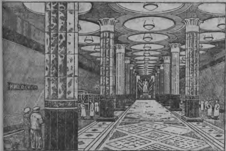
Суред вылын: Метро—„Киевская“ станцилэн пуштусыз.