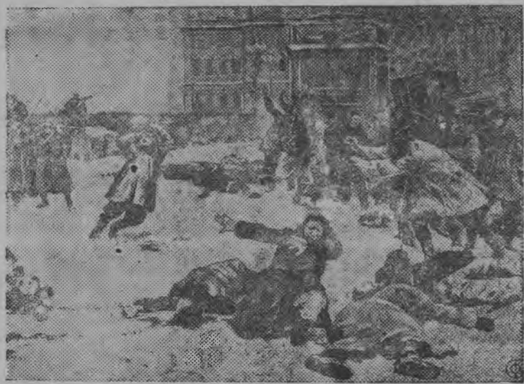
9 (22) январь 1905 аре Петербургысь Александровской коляонна дорын.

Курской областысь, Кривцовской районьысь „Завет Ильича“ сельскохоззяйственной артельын радиоузел оборудовать каремын. Жытазе колхозной клубзы калыкен тырмемын луэ. Уно колхозник'ёс репродуктор бастытзы ни.