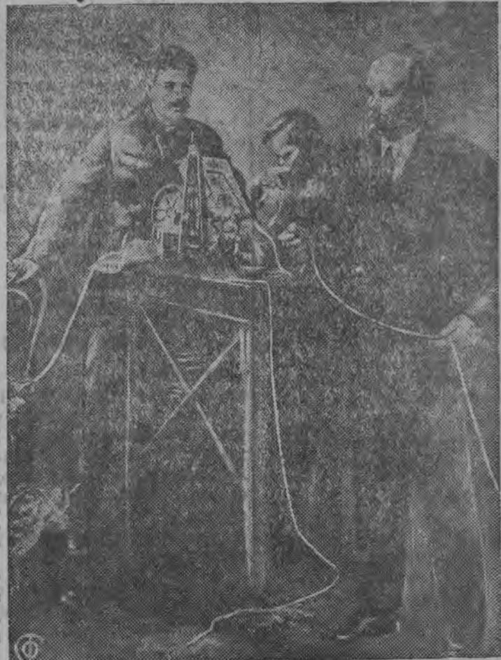
Ленин но Сталин 1918 арэ прямой провод дорын.

... Асьме дорысь кошкыкуз, Ленин эш Коммунист Интернационалэсь принцип'есэз шонер быдэс'яны косыса кельтиз. Ленин эш, быдэс дунньысь ужаса улэсьеслэсь союззэс Коммунист Интернационалэз—юнматон но паськытатон понна ми улэмес ум жаялэ шуса тыныд кылмес сетиськом".