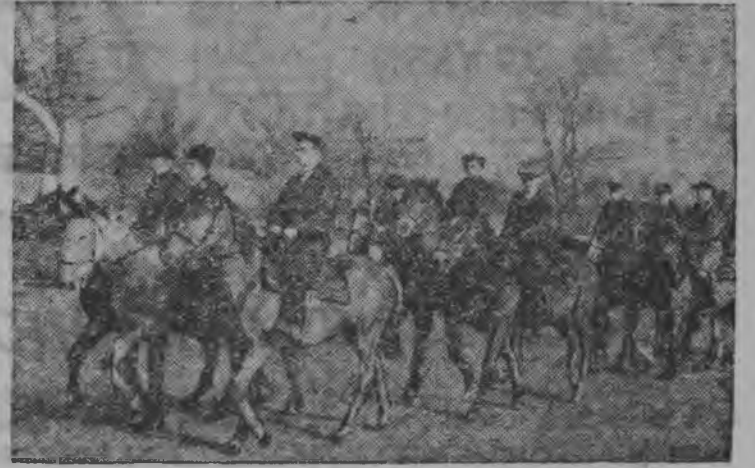
Полтавской областысь, Золотоношской районьсь Чапаевлэн нимыныз нима колхозысь ворошиловской всадникъёс тренировкаын.

Ю. Узбяковлэн рисункез.