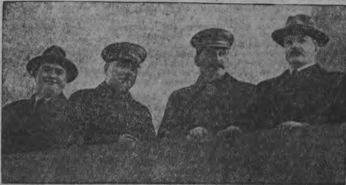
Бурьсен палляне: В. М. Молотов, И. В. Сталин, К. Е. Ворошилов но Г. М. Димитров эшъёс мавзолейлэн трибуназэ