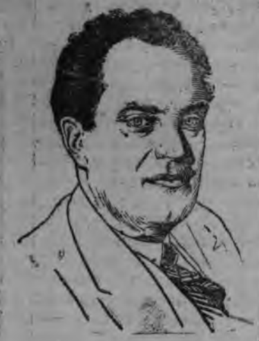
Суред вылын: В. В. Куйбышев

Ленинлэсь но Сталинлэсь верной соратниксэ, ЦК ВКП(б)-лэн политбюроезлэсь членэз В. В. Куйбышев эшез фашизмлэн наемник'ёсыныз троцкистско - бухаринской бандаосын злодейской виемзылы 25 январын 4 ар тырмиз.