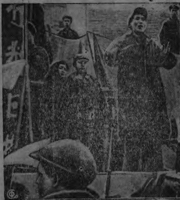
Китайыс советской областэзлэн Верховной Советэзлэн но правительстволэн главаез Мао-Цзэ-дун массовой собраниян Японской захватчик'ёслы энергичной отпор сэтэны, китайской калыккы вазиське.