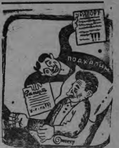
Подхалим (Альнискойлэн суредамез)