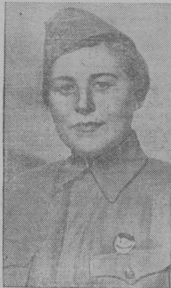
Великой отечественной войнаса участникъяс

Öнi быд финансовый ра- ботниклы колö сюрт- чыны октябрьводзвывса социалистической ордъяс- сьöмö да масса пöвсын агитационно-массовой удж развернитöм подув вылын срокысь водз выполнитны 1941 вося IV-өд квартал- лысь финансовый план став вид кузя быд сиктö- вет пасьта, кодi лөö фа- шистъяс кузя серьёзной ударён.