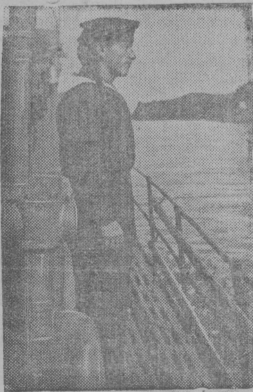
Амур вылын.