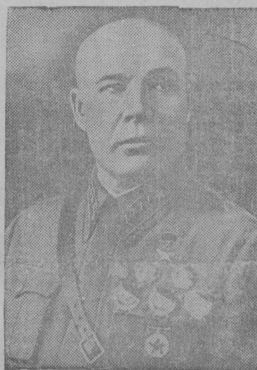
С. К. Тимошенко.