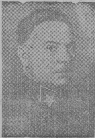
К. Е. Ворошилов.