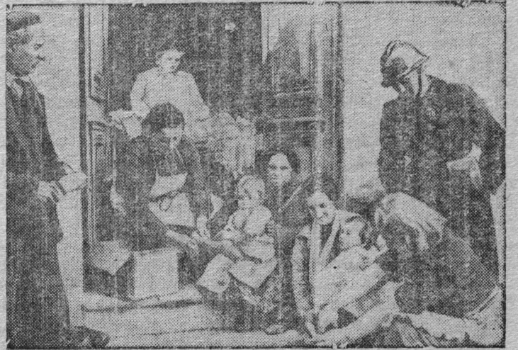
Снїмок вылын: французскōй погранїчнōј Булу карса ужалыс јōз сеталōны бельојас да кōмкотјас беженєцјас чєлафлы.

Франціјаса ужалыс јōз выжыд сїмпатїябн отнoсїтчōны Каталонїјаса беженєцјас дїнō да старатчōны кoкїдōны налыс вывтї сōкыд положенїесō.