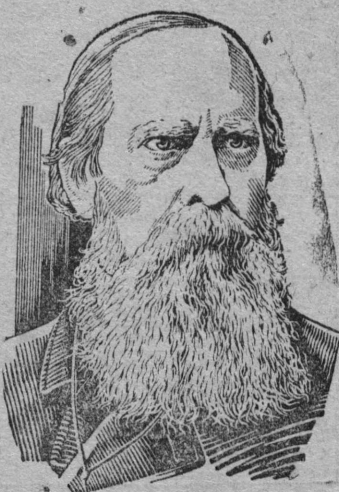
Величажӱ россӱкӱ писа- тел—сатирик М. Је. Салты- ков Щедрин — кулӱмсаы (1889 вога мај 10-ӱд лун) 50 во тыран лун. М. Је. Салтыков-Щедрин К. Теодоровичӱдӱн рисунок. ТАСС-дӱн бјуро-кӱше.