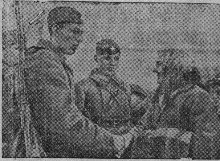
Снимок вылын: Пӱрысь крестьянка приветсвуйтӱ боецгьясӱ да командиргьясӱ (м. Молодченко)