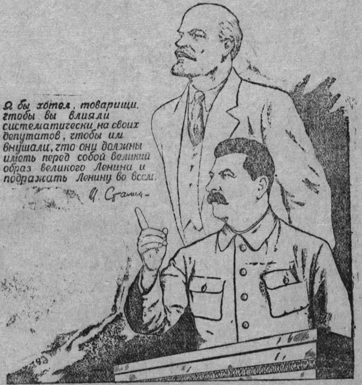
О бй хотел, товарищи, чтобы вы влияли систематически на своих депутатов, чтобы ил выжидали, что они должны илеть перед собой великий образ великого Ленина и подражать Ленину во всем.