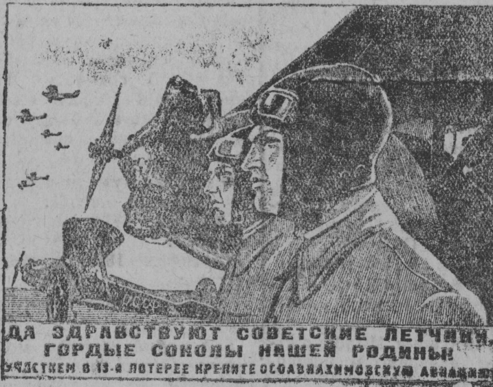
На снимке: Пилот, выпущенный Центральным Советом Осоавиахимом в 13-й Всесоюзной лотерее.

Кык лемеха плугјдн гбрдм нубдд Попов Се- рафим. Попов јорт быд- лун гбрд 1,2 га, 0, 3 га лунса норма дндо, а дтї лемеха плугјдн гбрдм нубдд Фаддєєв Степан, коді лунса норма 0,3 га местад гбрд 0,6 га. Кол- хозын гбра-кдза муно ыжыд кыпыслундн.