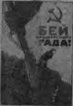
Рисунок художника Кокореккина

Перестроимся на военный лад и все подчиним на разгром всеобъемлющего врага!