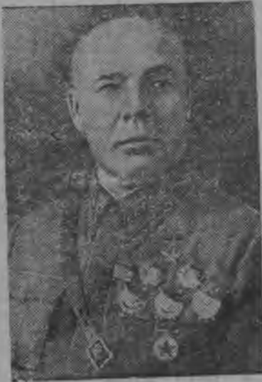
Народный Комиссар Обороны СССР, Маршал Советского Союза, Герой Советского Союза С. К. Тимошенко.

С. К. Тимошенко назначен Народным Комиссаром Обороны СССР.