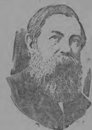
45 лет (1895) со дня смер- ти Фридриха Энгельса.

Депутаты Сессии устраи- вают т. Сталину и его соратникам восторженную ovation, длящуюся нес-