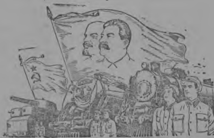
Рисунок В. Баркова и В. Лисевича. Фото-Клише ТАСС.