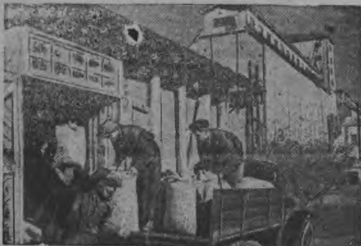
На Алексиковском элеваторе. Колхозники сгружают пшеницу, привезенную на своих машинах.

Колхоз „Ленинский путь“ (Ново-Николаевский район, Сталинградская обл.), закончив сдачу урожая, приступил к сдаче яровой пшеницы.