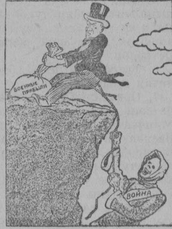
Американская репка. Дедка за репку, бабка за дедку...

Отмена запрета на вывоз оружия только удлинит сроки войны и втянет в войну Соединенные Штаты Америки. (Из газет).