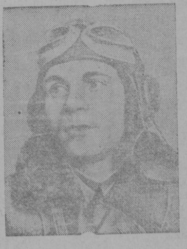
Герой Советского Союза капитан Михаил Трофимович Трусов.