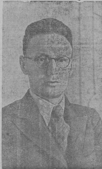
Турнирса участник—СССР-са чемпион,гроссмейстер М. Ботвин- ник (Ленинград).