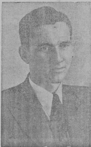
Чемпионатса участник—Эстон- ской ССР-са чемпион,гроссмейс- тер П. Керес.