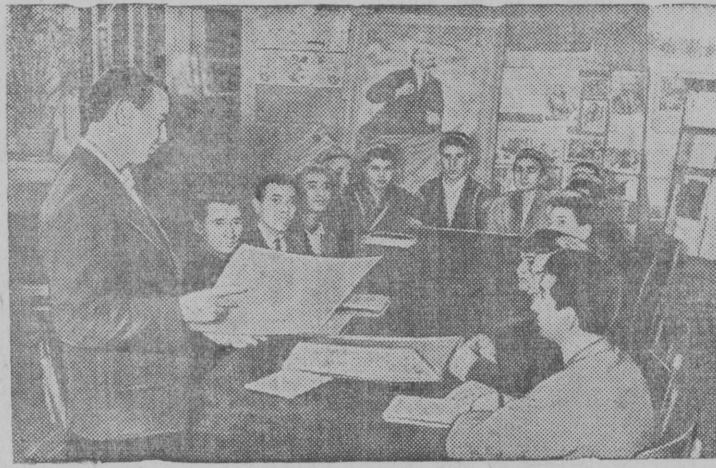
Пропагандист Ф. Халимов нудё ВКП(б) история кузя комсомольскёй кружокын занятие.

КП(б) Таджикистанса Канибадамскёй райком парткабинетын.