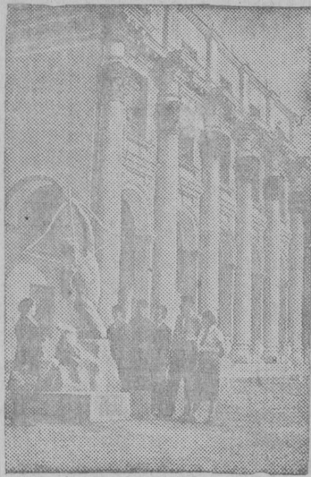
Гомель карын Чкалов нима выль педагогическый институтлөн выль здание.

В. С. Рочев, Красноборский зооветучастоккыс зоотехник.