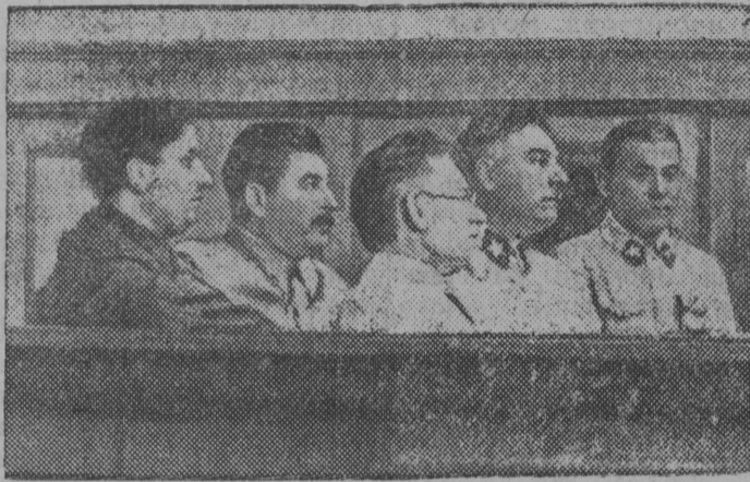
Снїмок вылын (шужгасаң вескыдө): Г. М. Ма- ленков, І. В. Сталин, М. І. Калинн, К. Јє. Воро- шілов, да Н. І. Јєзов РСФСР-са Верховнөј Сөветлөн первојја сессїя вылын.