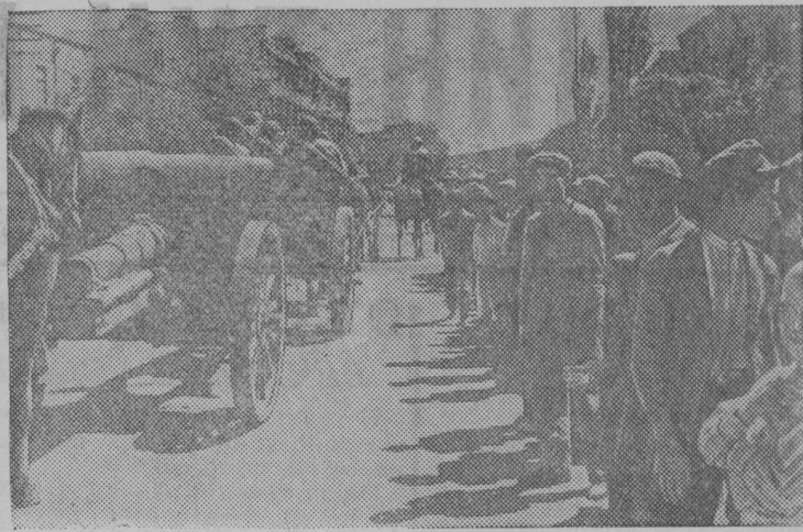
Советские войска в Иране. Части Красной Армии на улицах Тавриза.

гөрис 24 гектар, Молотов нима колхоз (председатель Н. П. Хозяшев) 22 гектар и сизз одз. Сельсовет пасья гөрөм 100 гектар. С. К.