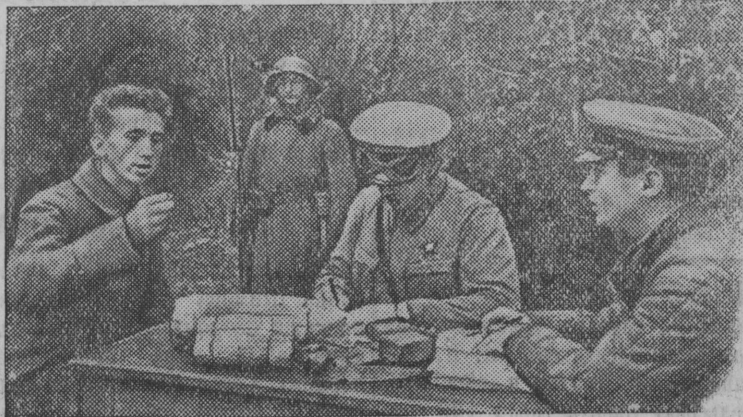
Допрос пленного немецкого солдата в штабе.