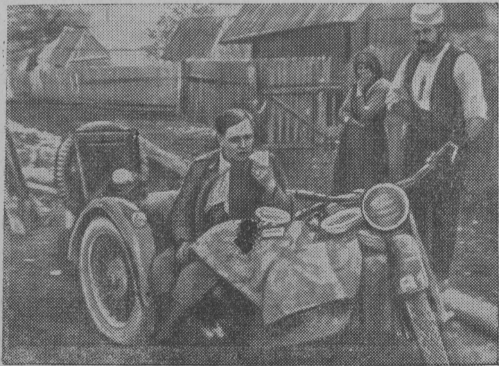
Точно ненасытная саранча орды гитлеровских бандитов опустошают города и деревни оккупированных стран. Обычная сценка в Югославской деревне: голодные крестьяне смотрят, как непрошенный «гость» гитлеровец пожирает отобранные у них продукты. (Снимок отобран у пленного фашиста).

Направление, указанное тов. Вчерашанским, было настолько удачным, что советские бойцы вышли из окружения без всяких потерь.