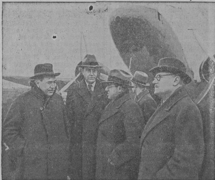
Встреча в Москве. Слева направо: лорд Бивербрук, г. Гарриман, Чрезвычайный и Полномочный Посол СССР в США тов. К. А. Умайский и Заместитель Председателя Совета Народных Комиссаров СССР, Заместитель Народного Комиссара Иностранных Дел тов. А. Я. Вышинский.